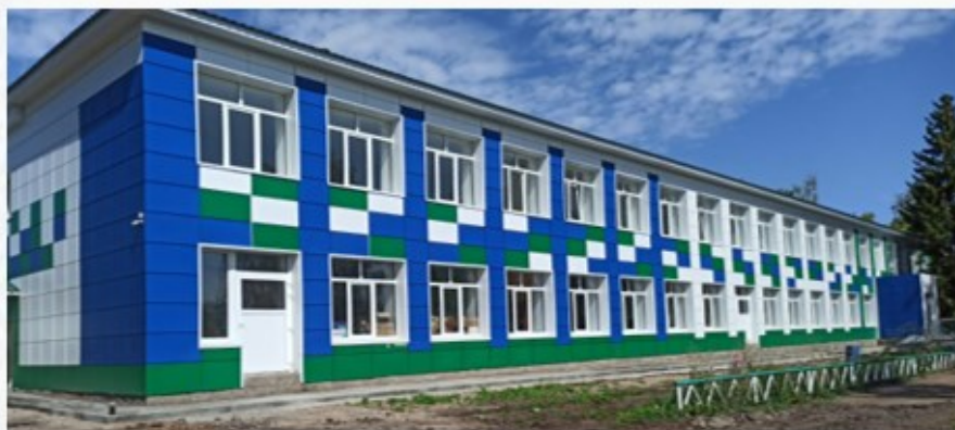
МБОУ «СОШ с. Чалмалы »