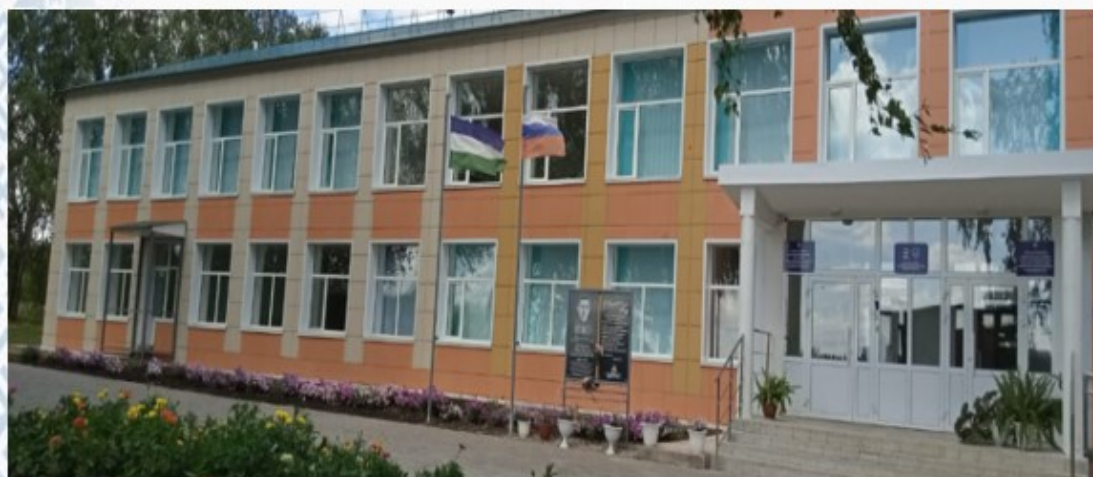
МБОУ «СОШ им. М.Егорова с. Базгиево»

Педагогические работники и управленческие команды, осуществляющие учебный процесс в объектах капитального ремонта прошли дополнительные КПК в 2022 и 2023 годах.