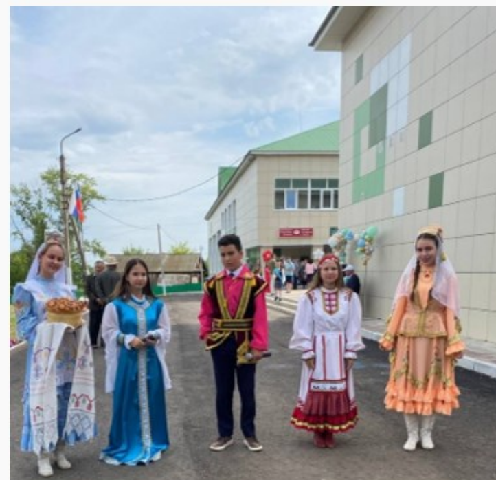
МБОУ «СОШ им. И.Абдуллина с. Зириклы»