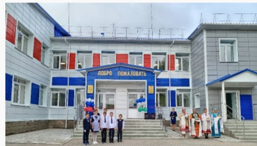
МБОУ «СОШ д. Сакты »