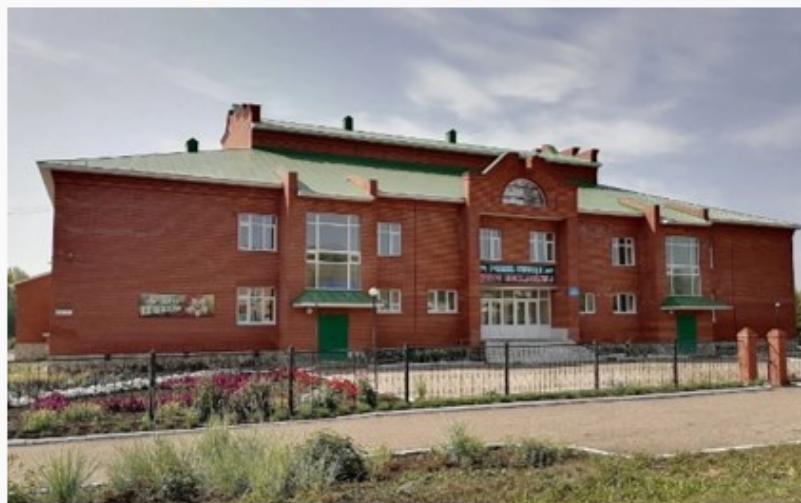
55 лет – филиалу МБОУ «СОШ №1 с. Шаран» – ООШ д. Енахметово