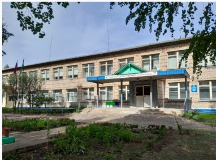
115 лет – филиалу МБОУ «СОШ №2 с. Шаран» – ООШ д. Старотумбагушево