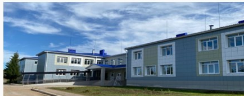
МБОУ «СОШ № 2 с. Шаран»