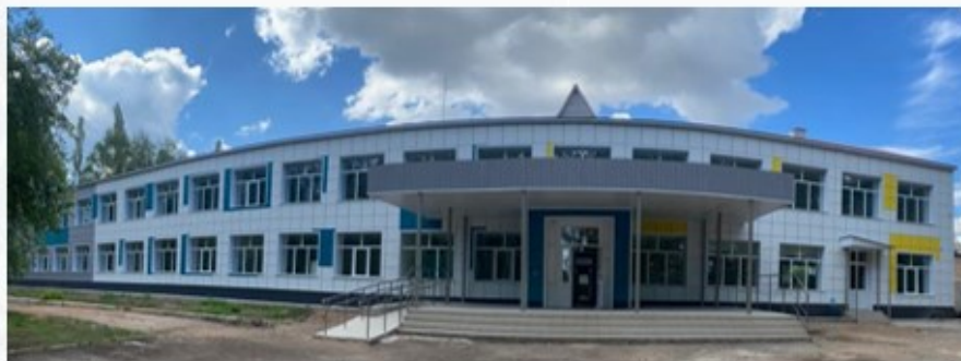
МБОУ «СОШ им. А. Кондратьева с. Дюргюли»