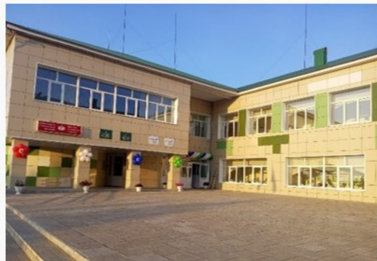
100 лет – МБОУ «СОШ им. И. Абдуллина с. Зириклы»