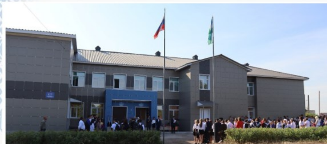
МБОУ «СОШ с. Наратасты»

Педагогические работники и управленческие команды, осуществляющие учебный процесс в объектах капитального ремонта прошли дополнительные КПК в 2022 и 2023 годах.